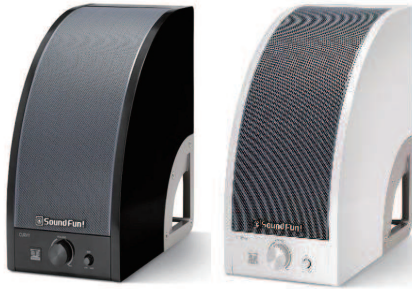
MIRAI SPEAKER 【カーブイー】 Curvy

聴こえにくい方の聴覚をサポートし、健聴者の方にも近くではうるさくなく、遠くまでハッキリとした音を届けるスピーカーです。