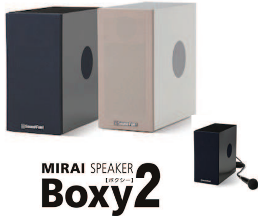
MIRAI SPEAKER 【ボクシー】 Boxy2